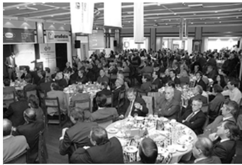
CONFERENCIA. Más de 300 invitados siguieron la ponencia del director de Ceres

La reforma que se ha propuesto es una suerte de colectivización del sistema de salud. El Estado terminará controlando el financiamiento, fijando las cuotas y determinando el modelo de atención. Estos sistemas de planificación